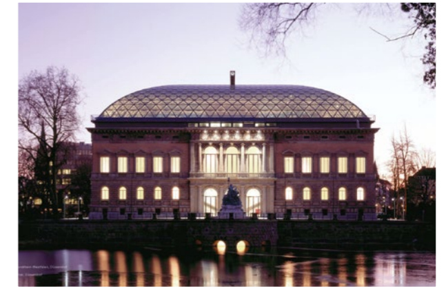
K21 Ständehaus