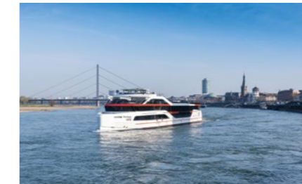
MS RheinGalaxie

dezenten Farben gehalten. Allein 1.880 qm Boden wurden im gesamten Schiff verlegt. Das neue Lichtkonzept kann mit direkten und indirekten Beleuchtungseffekten eine besondere und stets dem jeweiligen Anlass angemessene