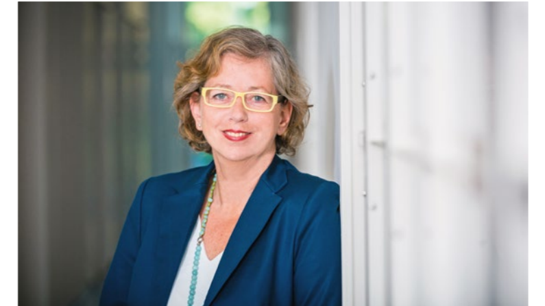
Jutta Kirberg von Kirberg Catering