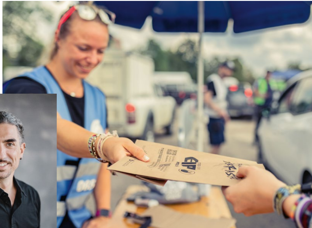
Anreisende beim Summer Breeze Open Air Dinkelbühl wurden gleich bei Ankunft mit den Thrasher Bags ausgestattet

Fragen an Daniele Murgia von 2bdifferent zur Festival-Sustainability