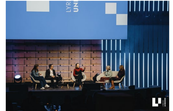
Lyreco Unboxed

standing ovation konzipiert Eventformat Lyreco Unboxed