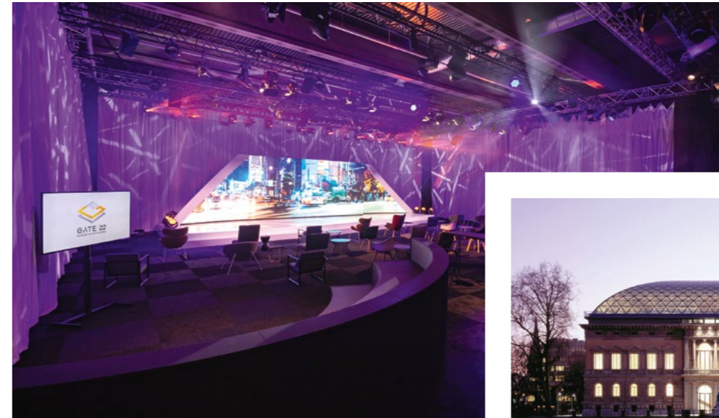
Gate 22