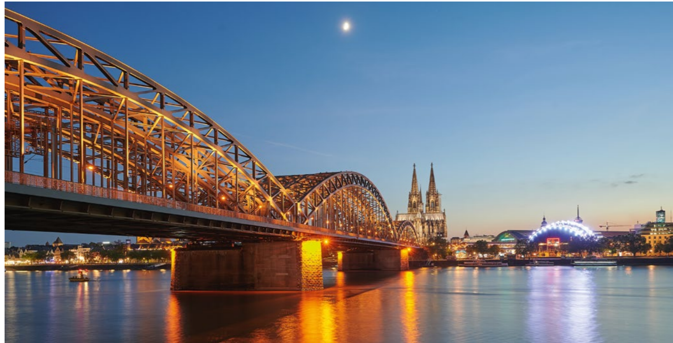
Rheinmetropole Köln

EINE STEIGERUNG DES ANFRAGEVOLUMENS UM 35 PROZENT IM VERGLEICH ZUM VORJAHR KONNTE DAS COLOGNE CONVENTION BUREAU (CCB) KÜRZLICH VERMELDEN. VIELE ANFRAGEN STAMMTEN DABEI WIEDER AUS DEN INTERNATIONALEN MÄRKTEN UND ZEIGEN, DASS AUCH AUSSERHALB DEUTSCHLANDS DAS MICE-GESCHÄFT UND DAS INTERESSE AM KONGRESS-STANDORT KÖLN WIEDER FAHRT AUFGENOMMEN HABEN.