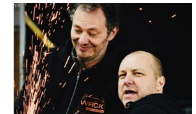
Geschäftsführung von WRCK Raumkonzepte