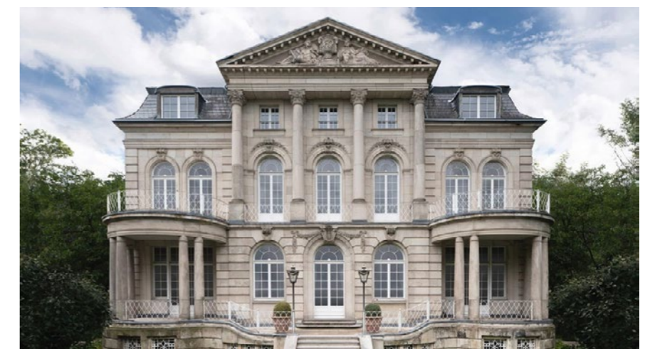
Villa Boissérée

Die Event Location im Herzen von Köln verfügt über drei multifunktionale Säle, eine Bühne, eine Lounge, ein Foyer und eine Marmortreppe im Zentrum der Villa. Ihre vielfältigen Nutzungsmöglichkeiten reichen von Bankett, Konferenz über Dinner, Party, Firmenfeiern bis zur Hochzeit. Auch als Film Set oder für eine Fashion Show ist die Villa Boissérée eine attraktive Bühne. Hinter der Location steht ein Team, das Kunden bei der Planung und Umsetzung unterstützt – von der Idee über die Organisation bis zur Realisation. Es gibt 21 VIP-Parkplätze, einen Premium Service und eine professionelle technische Ausstattung. Die Villa ist sowohl stunden als auch tageweise buchbar.