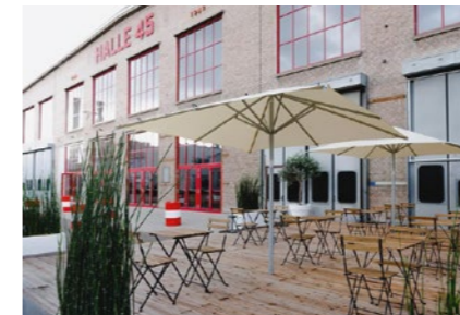
Halle 45