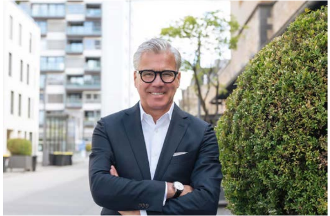
Johannes Molderings