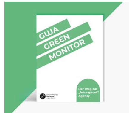
Studiengrafiken (Grafiken: GWA)