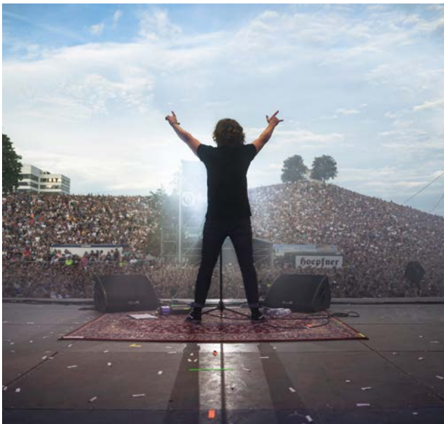
Impression Das Fest 2023

und Hügelkamm noch einmal richtig ein – mitendrin waren auch wieder das Lieblang-Team an den SOS-Inseln. Sie behielten an allen Tagen einen kühlen Kopf, gaben Auskunft, halfen bei der Suche nach Angehörigen und arbeiteten mit den Einsatzkräften der Sanitätsdienste und der Polizei zusammen. Von den rund 267.000 Besuchern hatten laut SWR rund 142.000 Karten für den Innenbereich am Hügel erworben. Dort befand sich nicht nur die Hauptbühne,