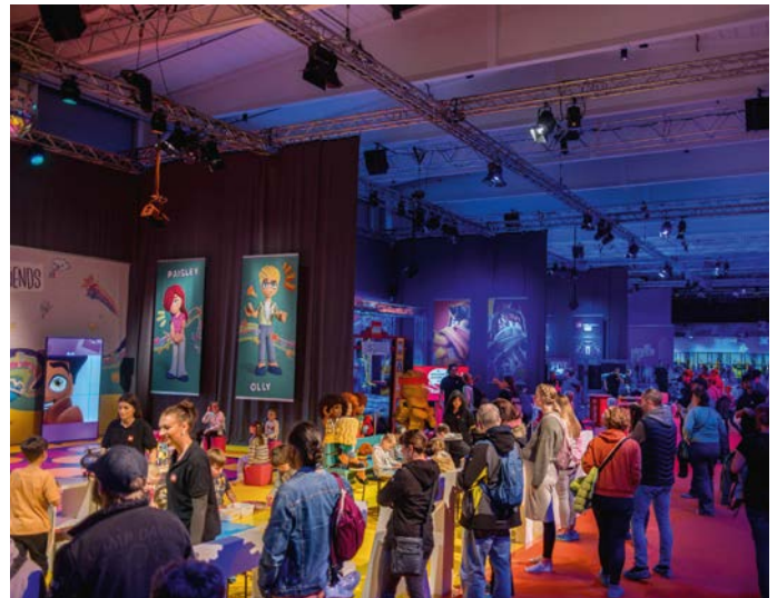
Lego PlayZone in der Grand Hall der Zeche Zollverein