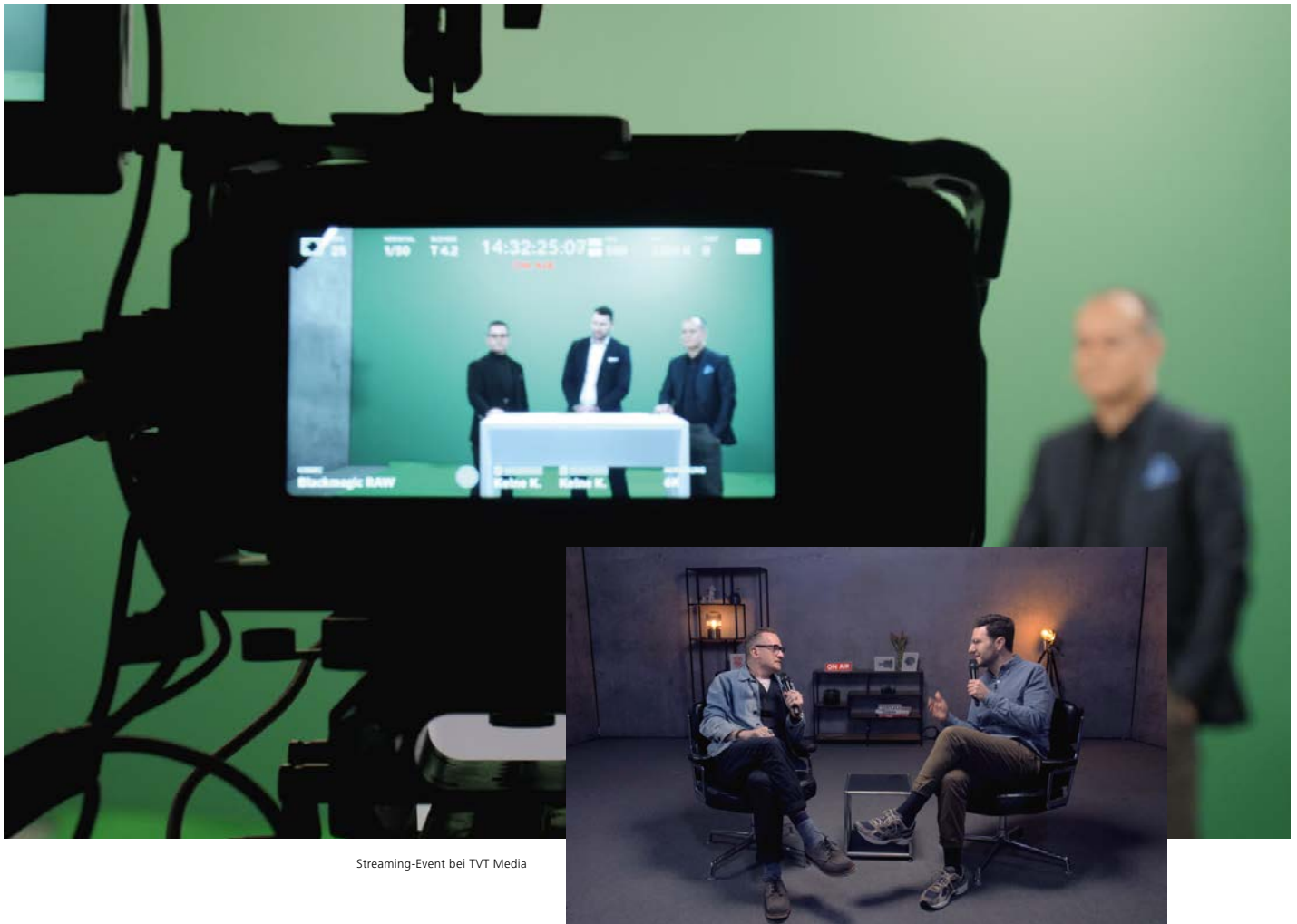
Streaming-Event bei TVT Media

TVT Media entwickelte Angebot für mobiles Livestreaming