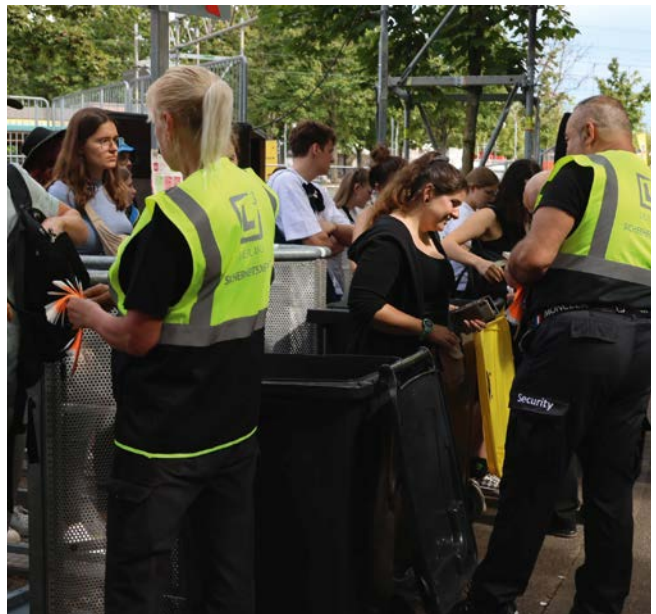
Lieblang Sicherheitsdienste begleiten „Das Fest“