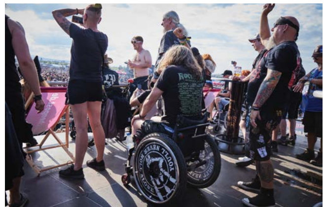
Defender-Produkte beim Rockharz Festival

Auftritte von Blind Guardian, In Flames, Arch Enemy und vielen mehr zu genießen. Damit das Rockharz in diesem Jahr für alle Besucher zu einem großartigen Erlebnis werden konnte, haben sich die Veranstalter für den Einsatz von Kabelbrücken des Defender Midi 5 2D Modulsystems entschieden.